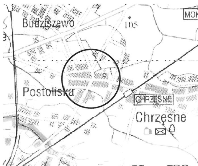
MAPA ORIENTACYJNA SKALA 1:25 000